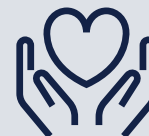
Granty a charitatívne dary